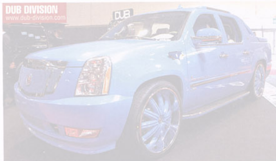
DUB DIVISION www.dub-division.com