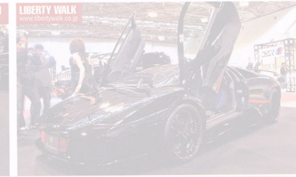
LIBERTY WALK www.libertywalk.co.jp

広大なスペースに12台がディスプレイされたLUXGブース。御協力いただいた皆様、どうもお疲れ様でした。■ DUB DIVISION :キャデラック・エスカレードEXTは2月号で、ハマーH2 SUVは 今月号(P23~27)で大々的に採り上げた。とにかくそのインパクトの大きさはハンパじゃないので、読者の皆さんもいちどは生で見たいものだ。日本中のイベントを脚踏していただきたいものだ。 ■ GMG :日本ではランドクルーザー・シグナスとして発売されている高級フルサイズSUVのレクサスLX470はGMGから。シャンパンボディに合わせ、ROJAMリムはゴールドカラーにペイントされ装飾。 ■ CROSS :ホイール、スピナー、ブレーキシステムなどにオリジナルブランドを持つCROSS。足元には同社オリジナルのH2専用リム「Type-CR 16」の25インチがセットされている。インテリアもアルカンターラでフルカスタムされ、モニターのインストールもハンパないレベルで仕上げられていた。 ■ GARAGE NEON-TEZZEN XXL を履かせたH2。27インチに見せる「例の」ギミックはさすがLEXANIファミリー。エクステリアではグリルやテールライトガードなどに注目。さらにインテリアに目を向けると、ダッシュボードやインパネまわりをはじめ至るところにクローム化が施されていた。 ■ LIBERTY WALK :リパティウォークはタイムグリーンのほかにもう1台、ブラックモデルをLUXGブースへ運び込んだ。ホイールはWORKのLS105。ブラックカラーに赤いラインが入ったリムでスポーティさを強調。