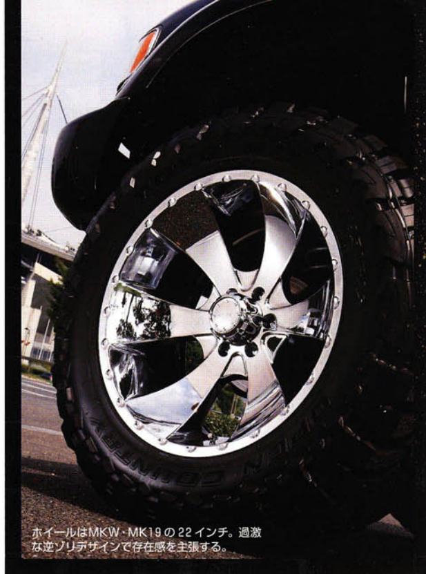
ホイールはMKW・MK19の22インチ。過激な逆ソリデザインで存在感を主張する。

さらに、走行安定性を高めるハイ キャスブラケットも装着。こちらも アルミ削り出し風の仕上げで高級感 たっぷりだね!