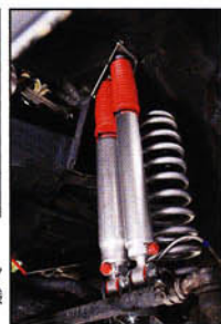
強烈なツインダンパー仕様で魅せる。