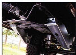
走安性がアップするハイキャスブラケット。