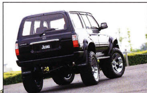
リヤはLEDテールやメッキモールでスタイルアップ。